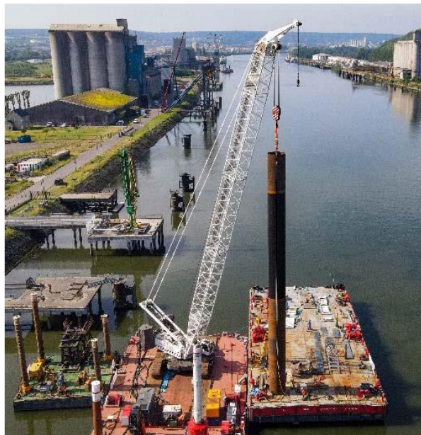
Matériel de battage des pieux

Le début effectif des travaux est intervenu début mars 2023 pour une durée prévisionnelle de 16 mois avec une phase de battage de pieux pouvant générer des nuisances sonores entre mi-juillet et début septembre 2023.